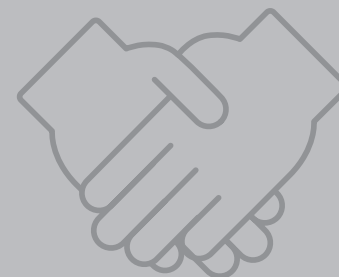
SILNÝ A MODERNÍ SVAZ